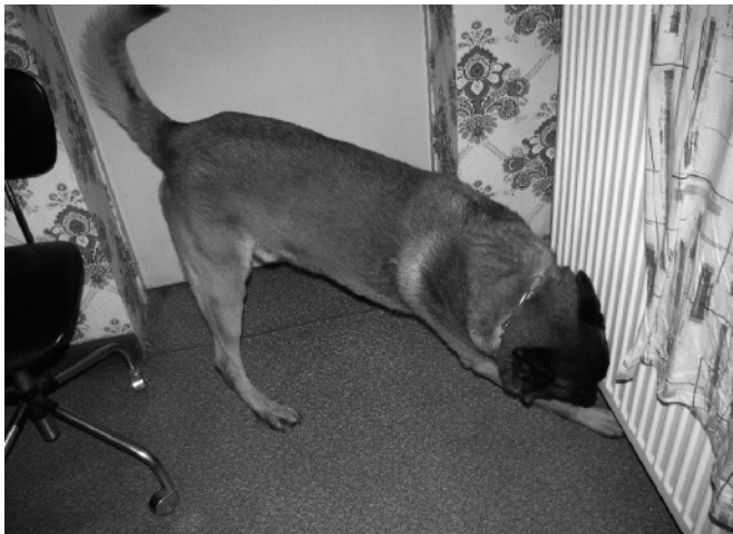
Bild 1. Der Schimmelspürhund bei der Arbeit.

Stichprobenartige Überprüfungen von Materialproben/Bauteilöffnungen reichen aus, um großflächige Bauteile mikrobiologisch zu charakterisieren – ein umfangreiches zerstörendes Arbeiten mit zahlreichen Bauteilöffnungen entfällt.