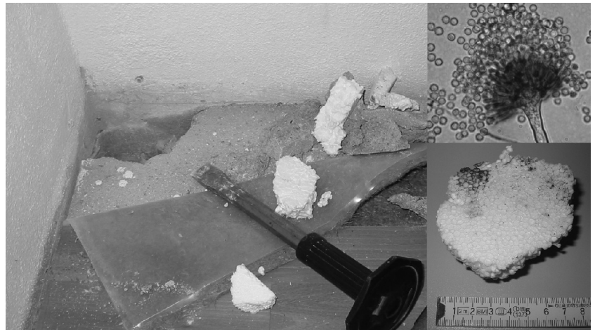
Bild 2. Materialprobenentnahme: Auf der verfärbten Polystyrol-Dämmung (unten rechts) war im konkreten Fall Aspergillus versicolor nachweisbar (oben rechts, stark vergrößert bei mikroskopischer Betrachtung).

Bei Vorliegen von keimfähigen Sporen wurde die Einzelprobe ab einer Summenkonzentration an Schimmelpilzen oder Bakterien von 10^5 KBE/g (KBE = Kolonie bildende Einheiten) bzw. einer Summenkonzentration von mehr als 10^4 KBE/g beim dominanten Vorliegen von typischen Feuchteindikatoren wie Aspergillus versicolor , Acremonium -Arten oder Actinomyceten (sporenbildende Bakterien) als mikrobiell belastet bewertet.